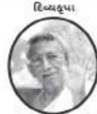
દિવ્યદુષા સહવાન યોગી આ.ટે. કીમદ વિજય કલાપૂર્ણસુરિશરણ મ.સા.